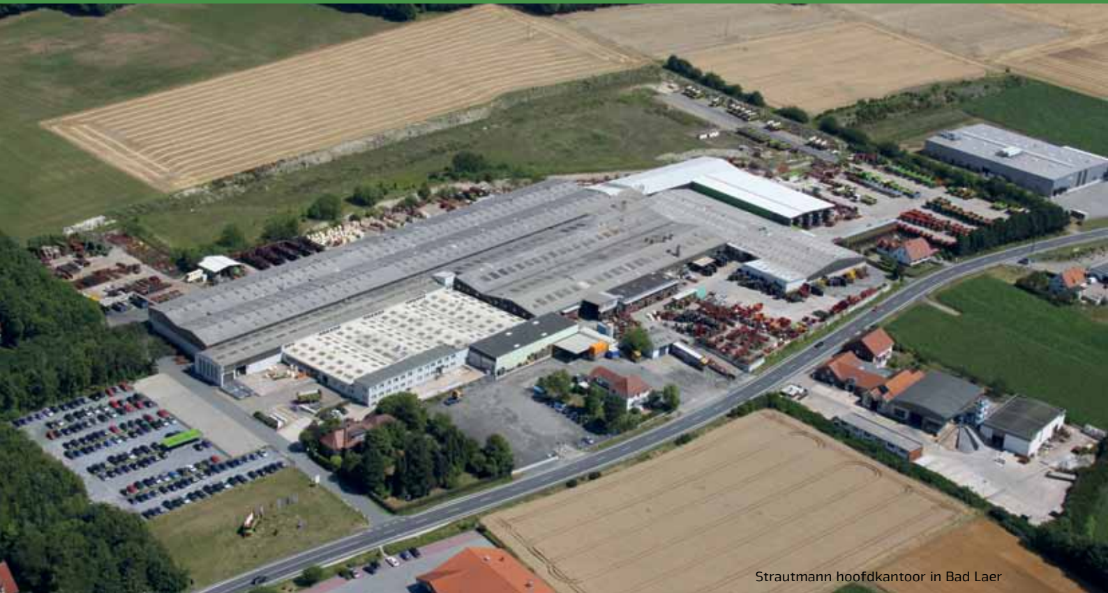
Strautmann hoofdkantoor in Bad Laer

De onderneming B. Strautmann & Söhne GmbH u. Co. KG is een middenstandsfamiliebedrijf in het district Osnabrück dat nu na een ruim 80-jarig bestaan in handen is van de derde generatie. Op de tweede productie-locatie in Lwówek (Polen) produceert Strautmann in een moderne fabriek naast afzonderlijke machinecomponenten ook delen van het machine-