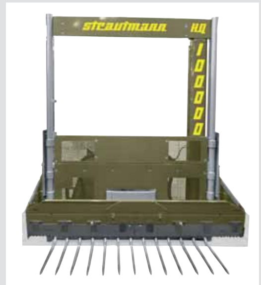
HQ met goudlak vanwege 100.000 stuks-jubileum